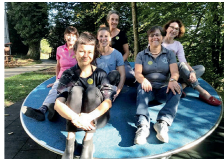
Das Team der Physiotherapie zur Hard heisst Sie herzlich willkommen.